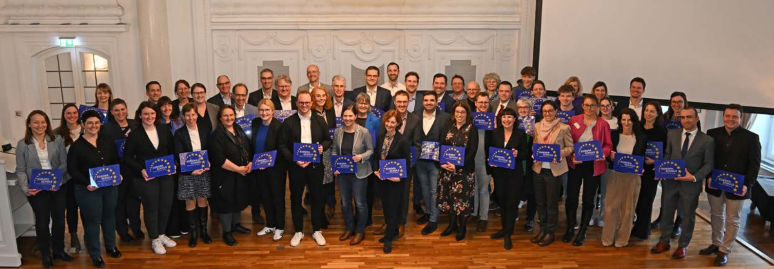
Zertifizierung und Übergabe der Plaketten an 50 Europaschulen im Weißen Saal in Stuttgart